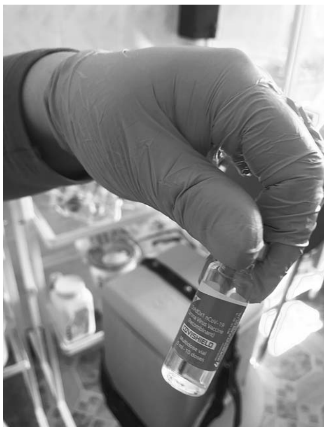
● Щеплення здійснюється препаратом Covishield, який схвалений Всесвітньою організацією охорони здоров'я та є аналогом вакцини AstraZeneca й виготовляється за ліцензійною угодою в Індії.

Наявність хронічних хвороб – теж не перешкода для проведення щеплення проти COVID. Треба лише попередньо проконсультуватися зі своїм сімейним лікарем, який фахово порадить, як себе вести тій чи іншій людині. Вакцинуватися можна навіть онкохворим, виняток складають лише випадки, коли пацієнт проходить період