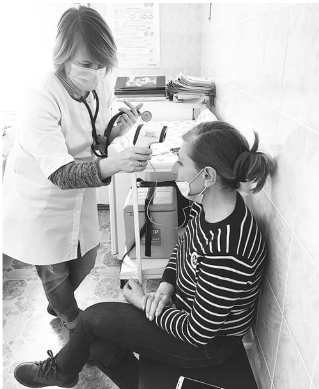
● Перед вакцинацією обов'язково вимірюється температура пацієнта.