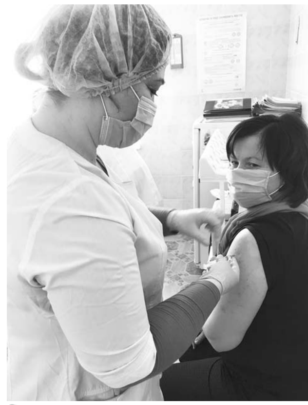
● Ну й останній етап – ін'єкція, яка сприятиме виробленню імунітету, здатного захистити людину впродовж року.

Аби дізнатися рівень своїх антитіл, слід здати кров на аналіз (у Березанці – по понеділках та середах), бажано натщесерце. Якщо імуноглобулінів багато – щеплення робити не можна, якщо дуже мало або нема – можна робити ін'єкцію вакцини.