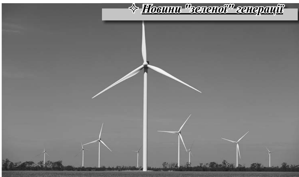
Новини "зеленої" генерації

Перед початком будівництва першої черги ДТЕК Тилігульської ВЕС компанія