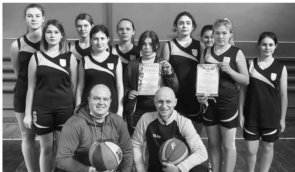
Збірна дівчаток Коблівської громади, яка здобула першість в зональних змаганнях з баскетболу, зі своїми тренерами.