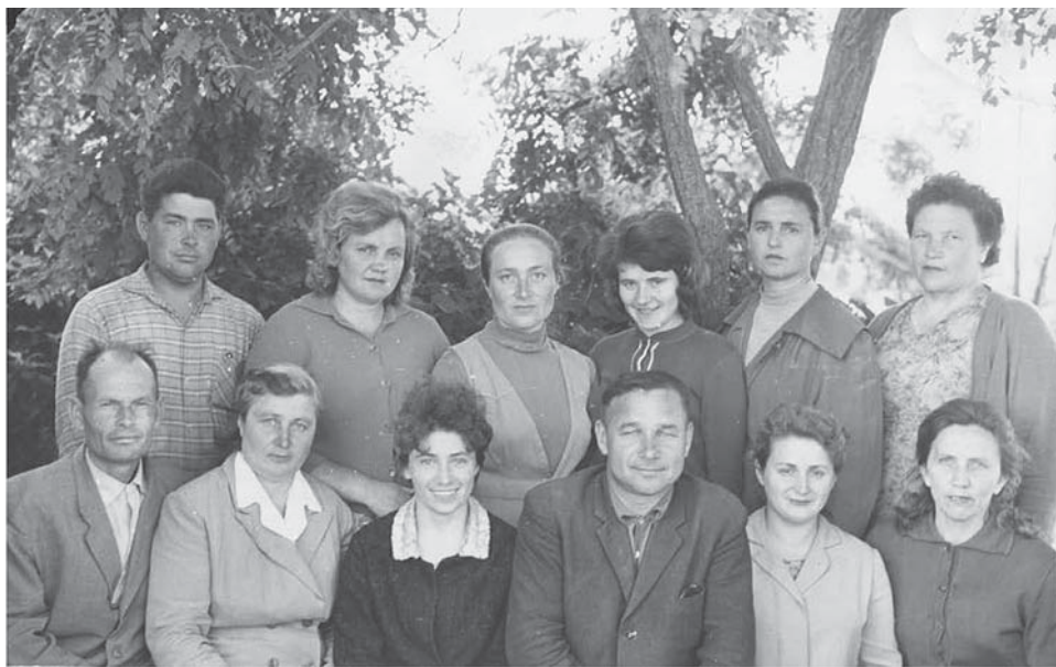
Ці люди – слава і гордість Лиманівської школи.

В 1930-их роках була запроваджена обов'язкова початкова освіта, що призвело