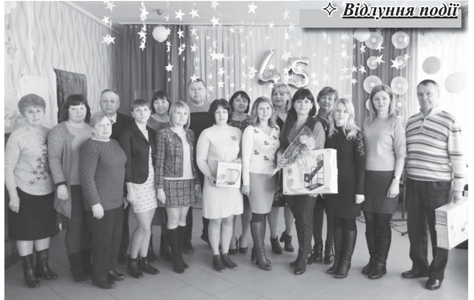
Педагоги школи-ювілярки та гості з Березанки.

Якщо будь-якій людині задати питання: "Які дороги свого життя ви можете пригадати, не напружуючи пам'ять?" – то практично кожен назве дорогу до рідного дому та рідної школи. Перші шкільні кроки, оцінки, успіхи і невдачі, досягнення й досвід, шкільні друзі та спільні справи, кохання і розчарування – це те, що ніколи не забувається на тернистих життєвих шляхах. І де б ми не перебували – близько чи далеко, в своїй країні чи за її межами, яку б посаду не обіймали, яку б роботу не виконували, ми завжди будемо пам'ятати, що стежина у доросле життя розпочалася від порогу рідної школи.