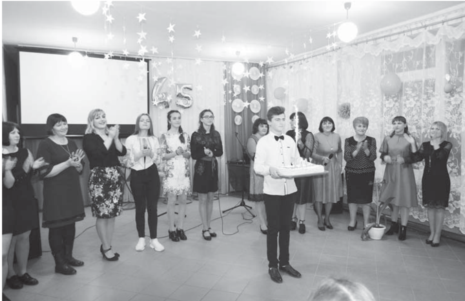
Останні акорди ювілейного свята.