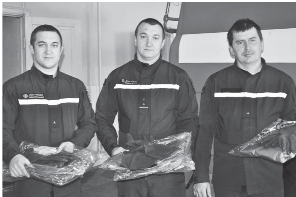
Сектор ДСНС України в Березанському районі отримав п'ять комплектів костюмів біологічного захисту, тож його працівники у разі необхідності готові доправити інфікованих до медзакладу.