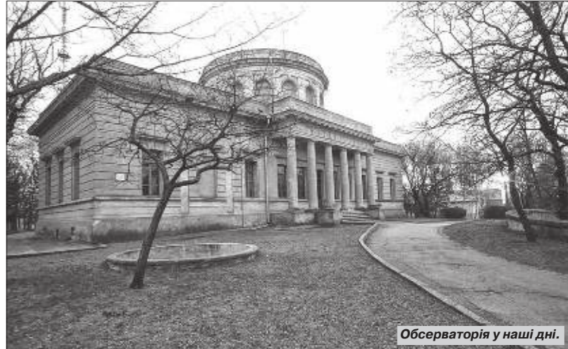
Обсерваторія у наш дні.

Але згодом й цього йому здалося замало. Він задумав створити у Миколаєві першу в імперії морську астрономічну обсерваторію. Проект був цілком новим, достатньо складним і коштував чимало