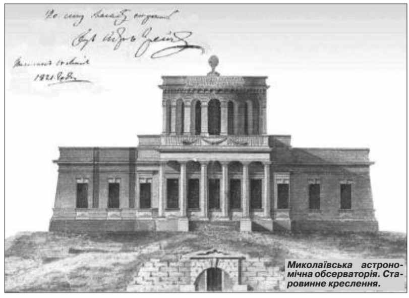
Миколаївська астрономічна обсерваторія. Старовинне креслення.