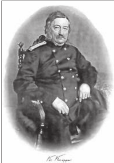
Карл Кнорре – перший директор Миколаївської астрономічної обсерваторії.

Кожна людина має якусь зародкову чин мічмана імператорського флоту. Але життя юнака зов-