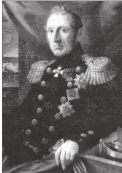
Олександр Грейг – військовий губернатор Миколаєва і головний командир Чорноморського флоту.

мірала Грейга була астрономія. Славного «морського вовка» тягнуло до зірок і він міг годинами спостерігати зоряне небо. Коли Олександра Грейга призначили військовим губернатором Миколаєва і командувачем Чорноморського флоту, він прибув до нашого міста і невдовзі наказав перебудувати дім головного командира (у цьому домі зараз музей суднобудування і флоту) таким чином, що прямо у